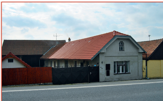
čp. 6 - 2016

Od roku 1800 do roku 1871 stála na návsi mezi čp. 5 a čp. 7 (v místě autobusové zastávky) obecní pastouška. Byla zbourána a na dnešním místě uprostřed obecních pastvin byl postavený nový dům. V roce 1924 čp. 6 vyhořelo. V roce 1934 byla postavena stodola s kolnou a vepřínem. Další stavební úpravy domu proběhly v letech 1959, 1966 a 1972.