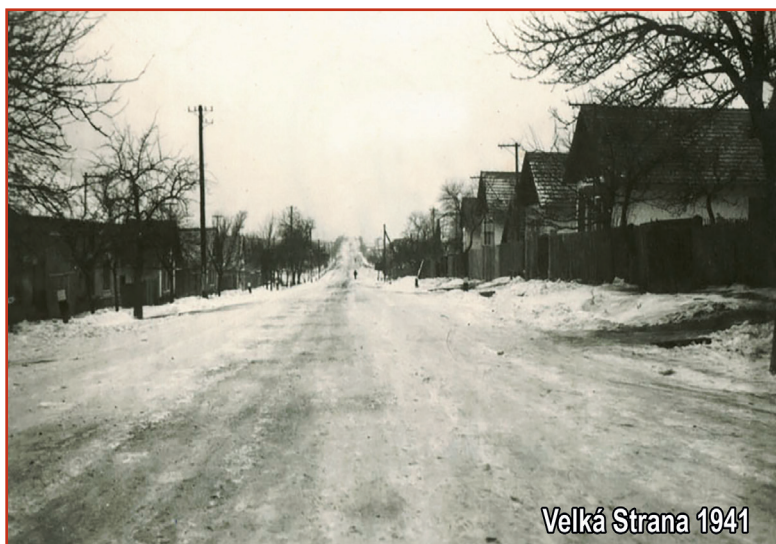
Velká Strana 1941