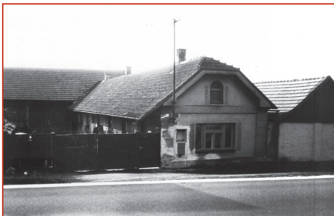
čp. 6 - 1993