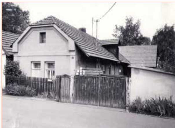
čp. 28 – 1993