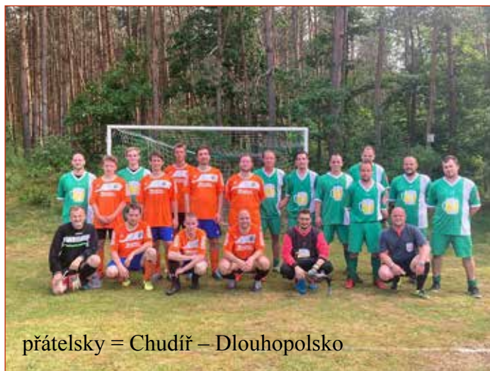
přátelsky = Chudíř – Dlouhopolsko

Na závěr pořadatelé předali ceny vyhodnoceným jednotlivcům: