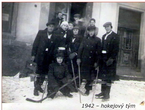
1942 – hokejový tým